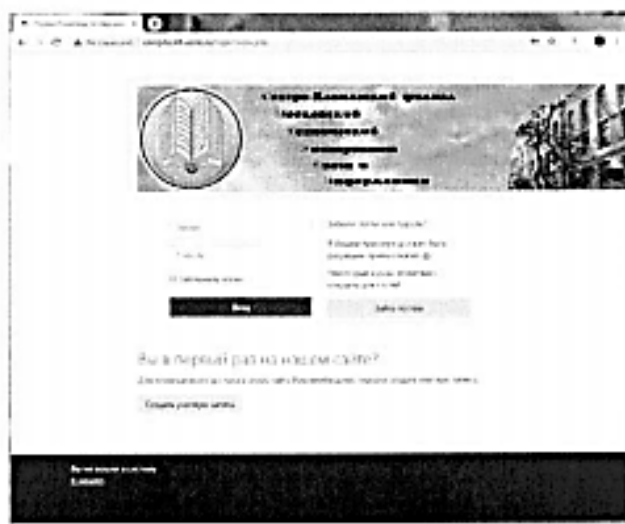
Рисунок 2. 2

Для регистрации необходимо при помощи одного из браузеров (предпочтительно Google Chrome последней версии) перейти по адресу http://olimpita.skf-works.ru/ , а затем кликнуть по ссылке «Вход» в правом верхнем углу страницы. Откроется страница входа на сайт, показанная на рисунке 2.2.