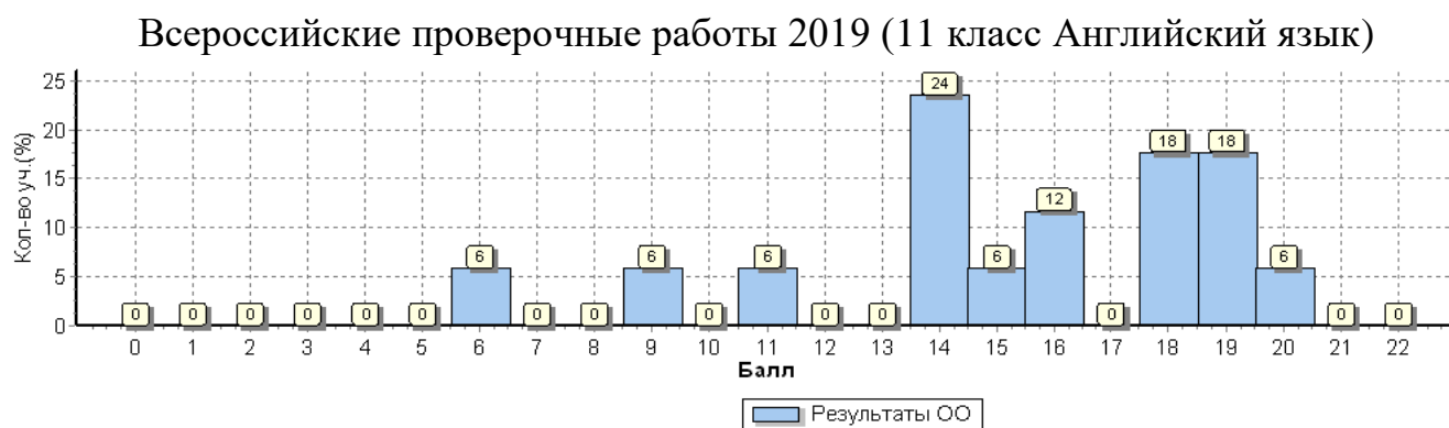
Рисунок 1. Распределение первичных баллов близкое к нормальному.