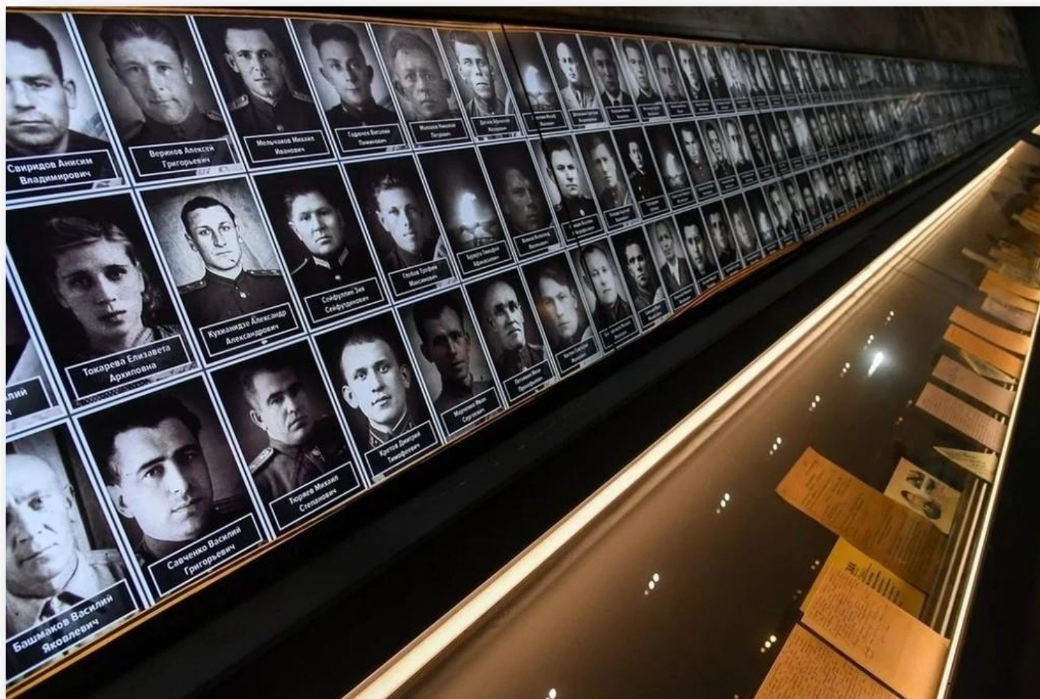
«Дорога памяти» парка «Патриот» Главного храма Вооруженных Сил России.