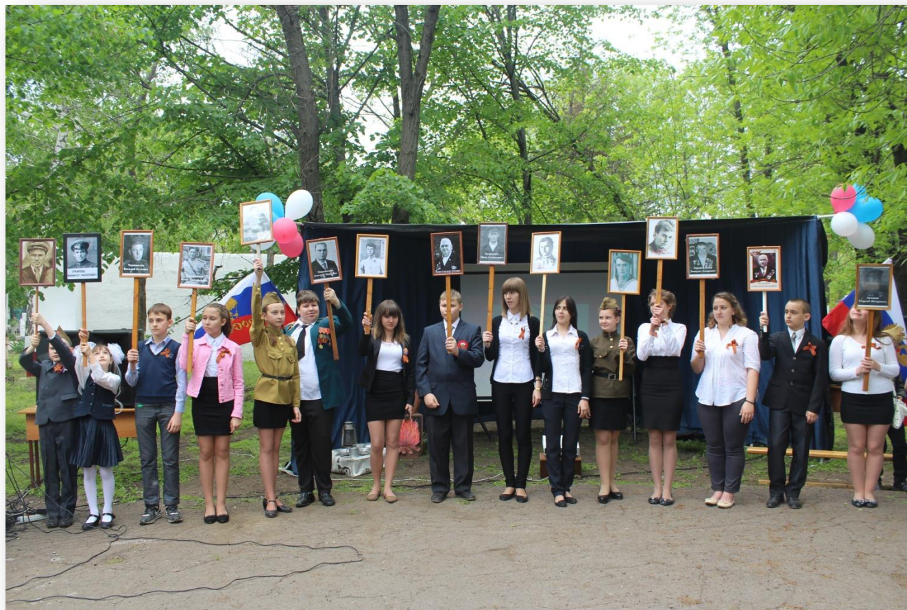
«Бессмертный полк» нашей школы.